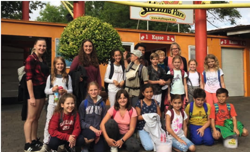
Einen spannenden Tag mit Nervenkitzel erlebten die Kinder und Jugendlichen im Skyline-Park