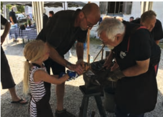
Vier Schmiede aus der Region trafen sich in Moosburg und zeigten den Kindern und Jugendlichen, wie man mit Hammer und Ambos umgeht. Die Teilnehmer durften sogar selbst ein kleines Herz schmieden.