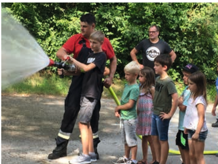
Ein ganz besonderes Gefühl erlebten die Haager Kinder und Jugendlichen kürzlich bei der Inkofener Feuerwehr. Denn sie löschten im Rahmen des Ferienprogramms brennende Paletten mit einem Feuerlöscher. Auch dieses Jahr beteiligten sich die Kameraden der Feuerwehr Inkofen wieder am Ferienprogramm der Gemeinde und organisierte einen ganz besonderen Nachmittag. Nach Informationen zur Schutzkleidung, ihren Funktionen und zur Ausrüstung des Feuerwehrautos durften die jungen Gäste schließlich selbst aktiv werden. Erstaunt stellten sie fest, wie stark der Druck war, mit dem der Wasserstrahl aus dem Feuerwehrschauch kam, als sie damit Wassereimer, die zu einer Pyramide aufeinander gestellt waren, möglichst schnell vom Tisch spritzten. Ein weiterer Höhepunkt war die Fahrt mit dem Feuerwehrauto. Ina