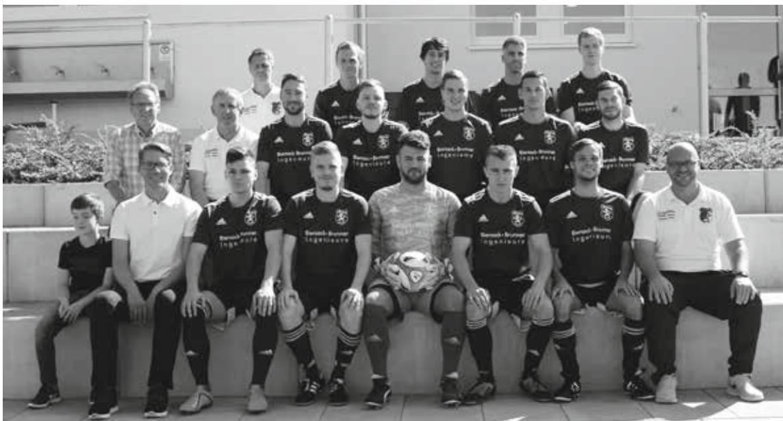
Neue Trikots für die erste Mannschaft sponserten Biersack Brunner Ingenieure.