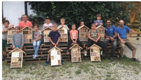
Ruhig und konzentriert bauten die Nachwuchshandwerker in der Zimmerei Maier ihre Insektenhotels